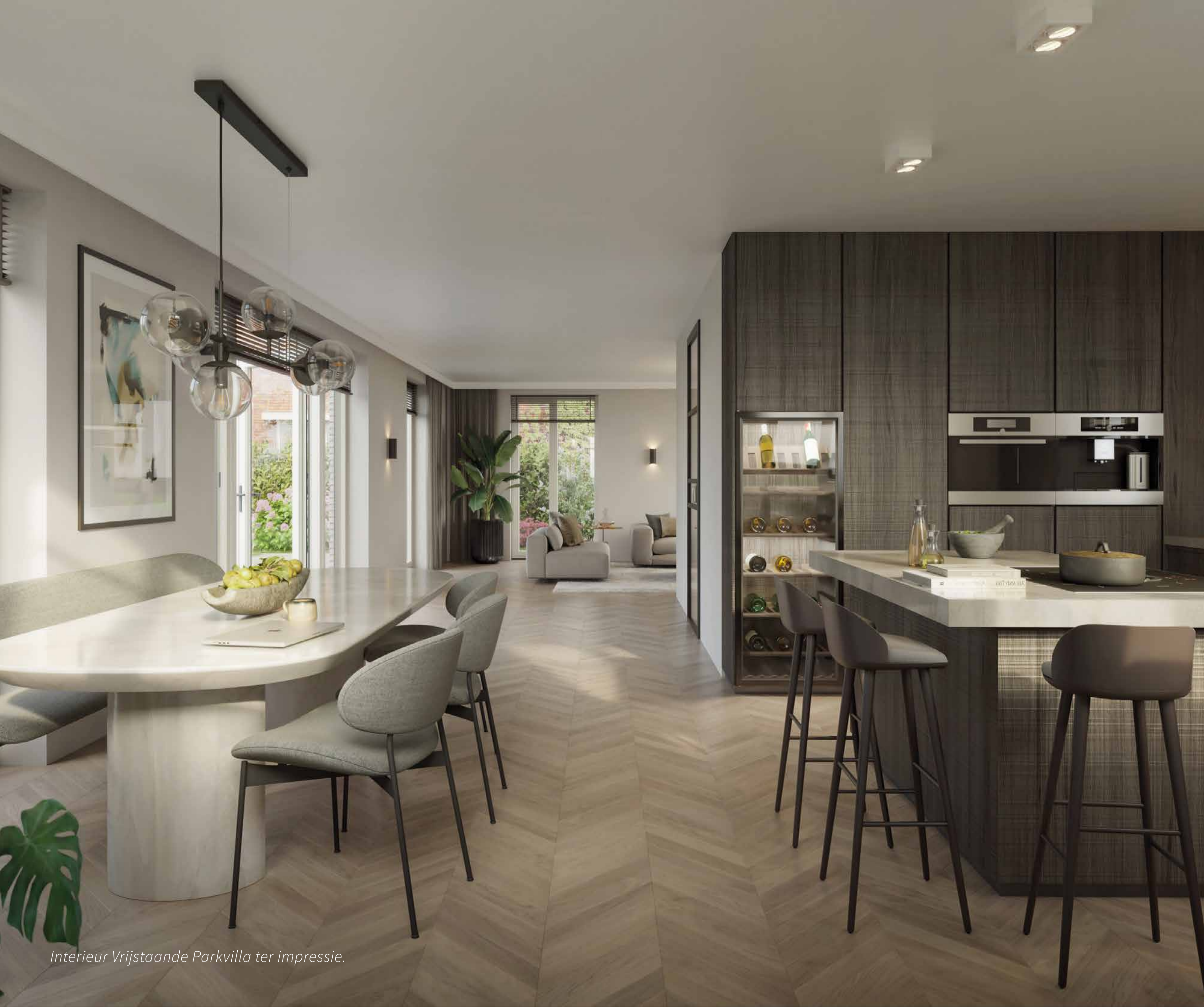
Interieur Vrijstaande Parkvilla ter impressie.