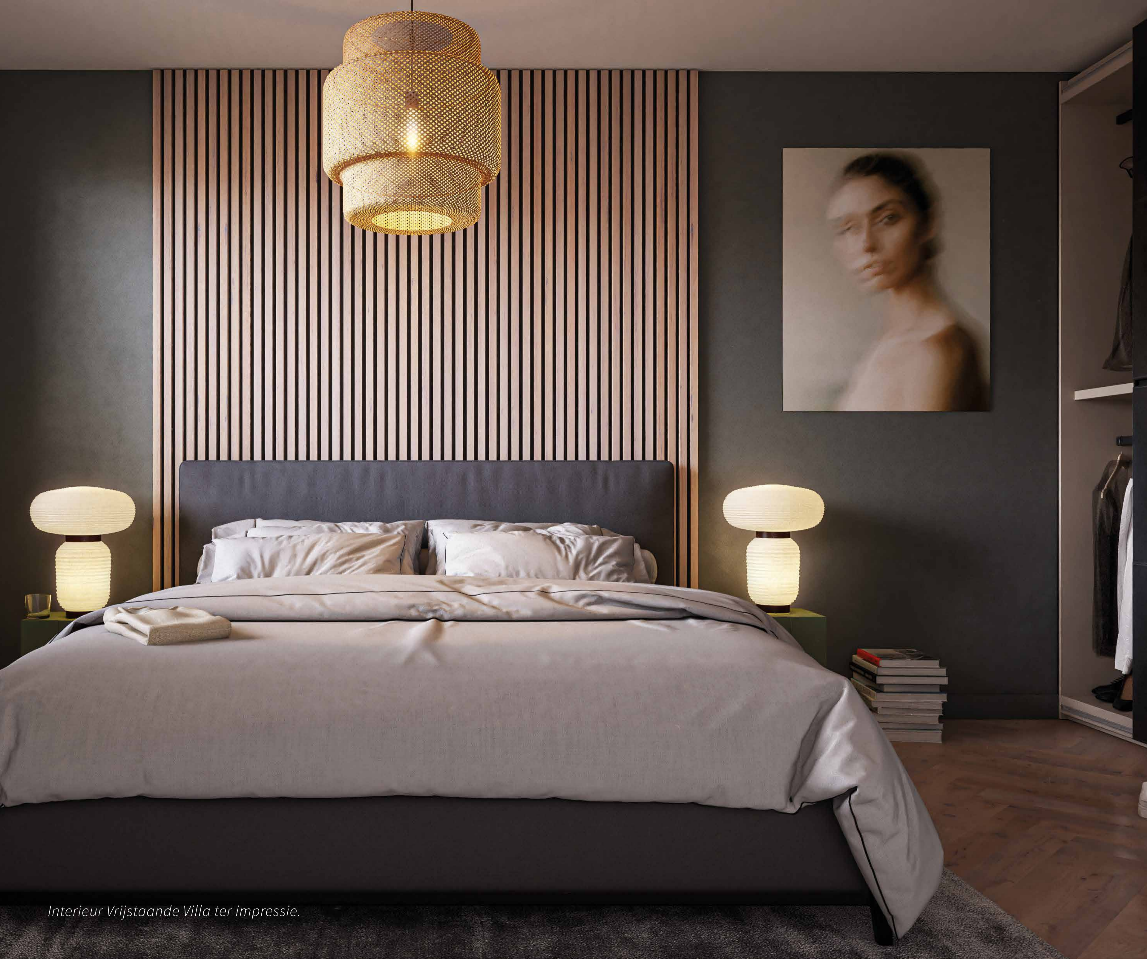
Interieur Vrijstaande Villa ter impressie.